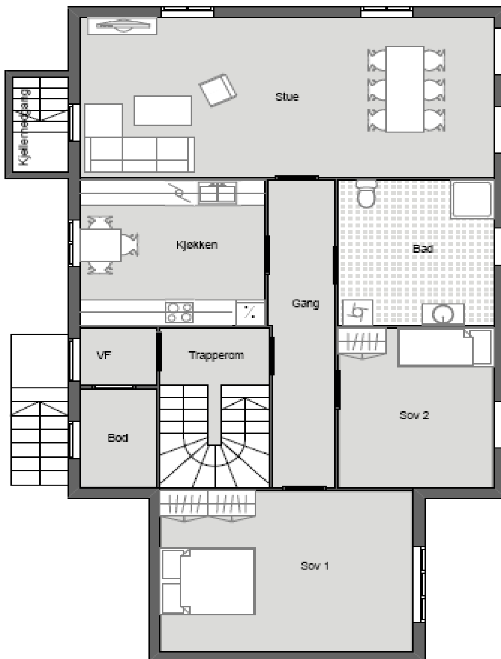
Plan 1. etasje

Boligområdet kalles "Andrenbakken" Gamle skogheim og den ene byggingene består av to 3 roms leiligheter, horisontalt delt og i to etasjer med boder på loft. Felles inngangen i første etasje. Uteareal er felles på begge sider av huset. Plantegning viser romfordeling av leilighetene. Hvitvarer følger ikke med i leiepris. Leietager må selv tegne eget abonnement på leveranse av strøm og nettleie.