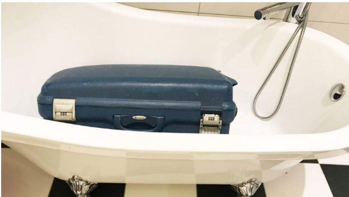
BRA STED FOR OPPBEVARING: Veggedyr sliter med å gå på badekar på grunn av den glatte overflaten.