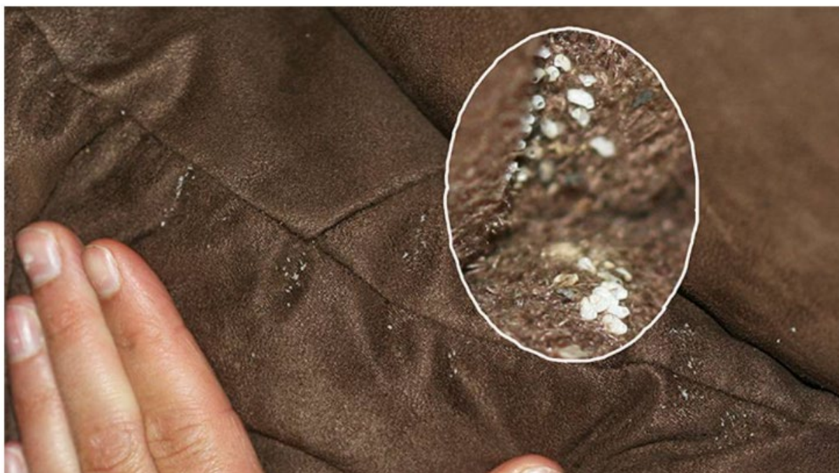
EGG: På veggedyrenes tilholdssteder kan man også finne egg og ekskrementer.