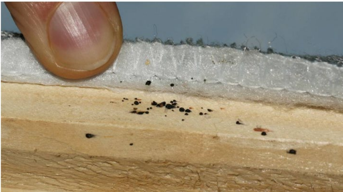
SPOR ETTER VEGGEDYR: De sorte ekskrementene er ofte enklest å finne, og det er derfor lurt å se etter disse.